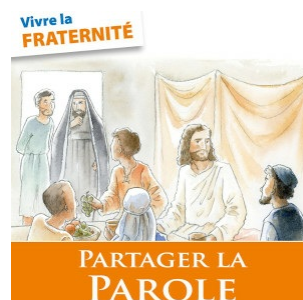
Le livret diocésain en ligne par Heinrich Block et Elisabeth Dizière : Clic