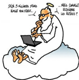
Évangéliser ... mais comment ? par Heinrich Block : Clic