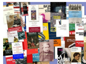
Un jour, un livre par Pierre Compagnon La sélection de janvier : Clic