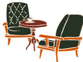
Rendez-vous avec ... par Pierre Compagnon : Clic