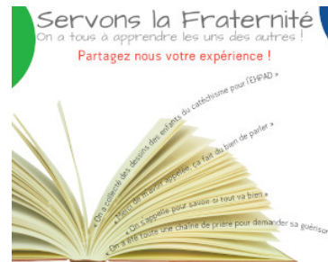
Servons la fraternité Partagez-nous votre expérience Lire l'article