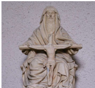
L'art sacré dans le diocèse La Sainte Trinité Lire l'article