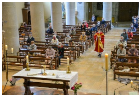
Reprise des messes La Pentecôte à Morez Lire l'article