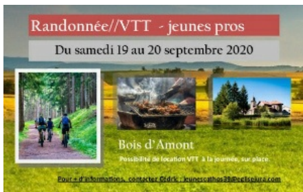
Camp VTT pour les jeunes pros Les 19 et 20 septembre 2020 Renseignements