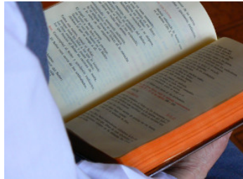
Les psaumes "Voir les voix" Lire l'article