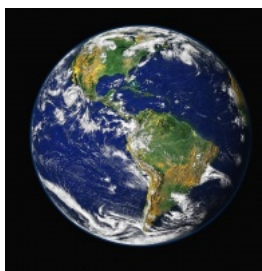
Echos d'ailleurs Des nouvelles de la Désirade : Clic du Japon : Clic