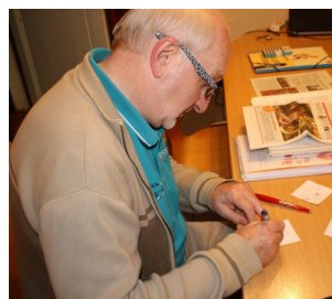
Homélies en BD Par Luc Aerens Retrouvez tous les dessins