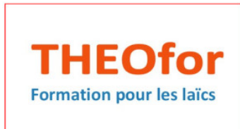
Une proposition du service de formation Une nouvelle promotion en septembre Lire l'article