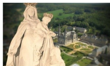
Les pèlerinages du ciel Montligeon "Toucher les cœurs, même après la mort" Du 19 au 23 novembre Inscriptions