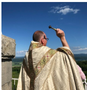
Les rogations Paroisse des Roches Lire l'article