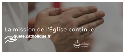
Quête en ligne MERCI à tous ceux qui ont donné. 11947 € de dons collectés pour le diocèse qui seront reversés dès que nous aurons le résultat par paroisse.