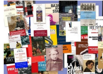
Le plaisir de lire Des recensions Pierre Compagnon Heinrich Block Observatoire Foi et Culture