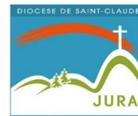
Les cercles de Châtel