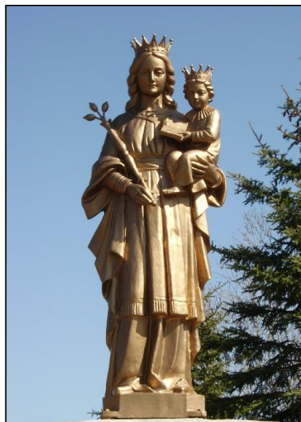
Notre Dame de Mièges