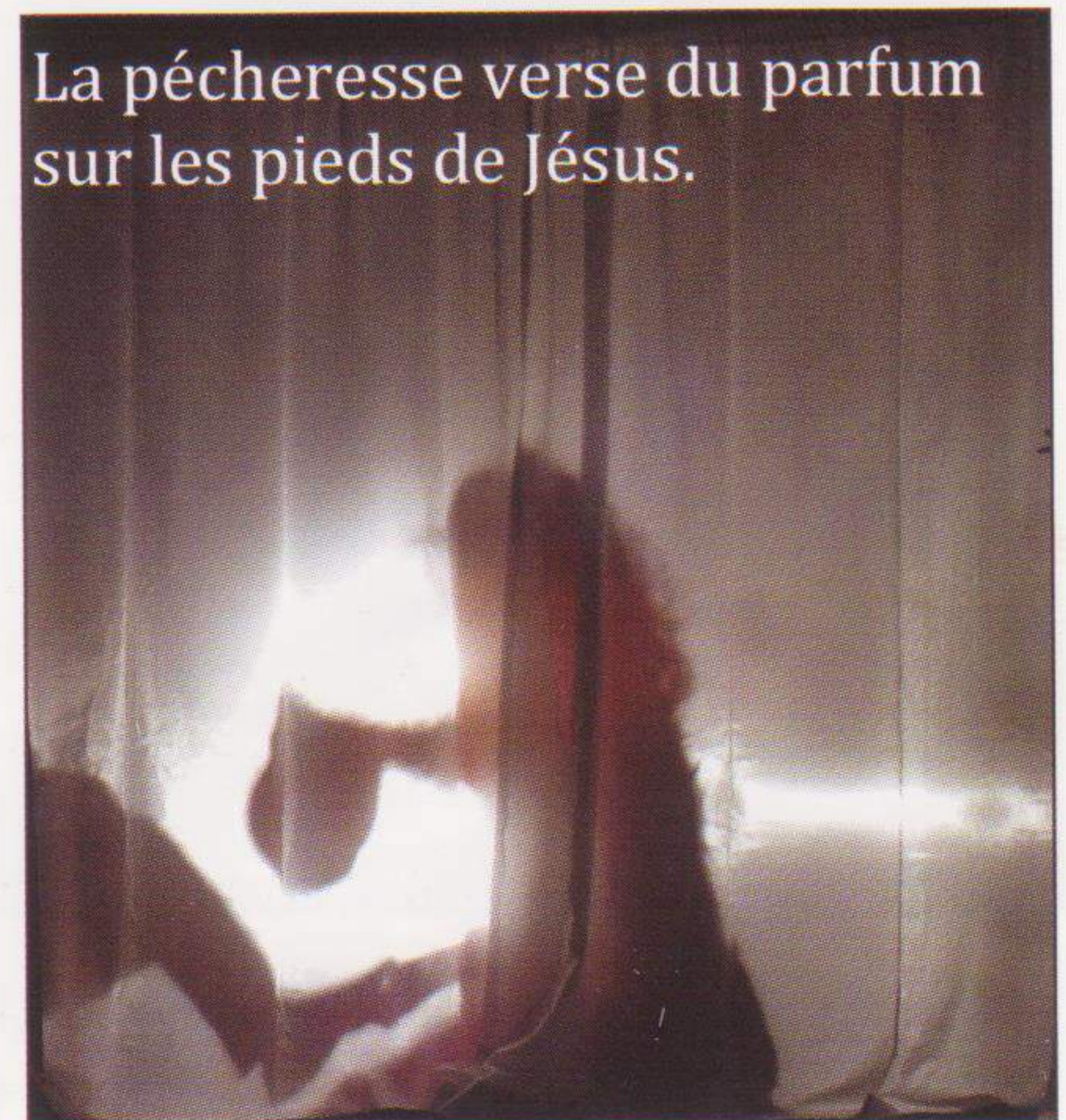
La pécheresse verse du parfum sur les pieds de Jésus.