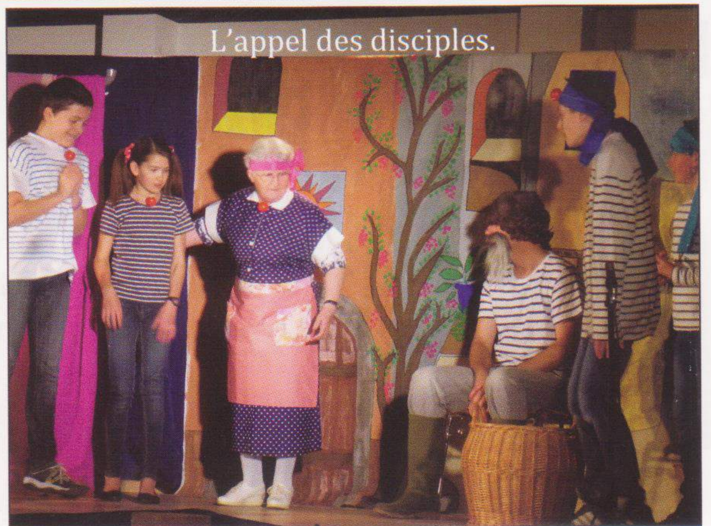
L'appel des disciples.