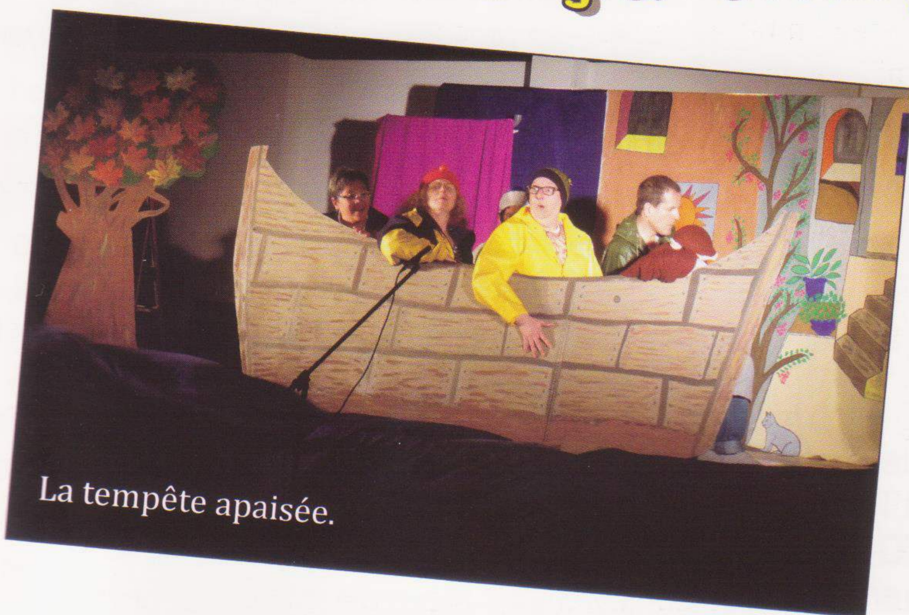
La tempête apaisée.