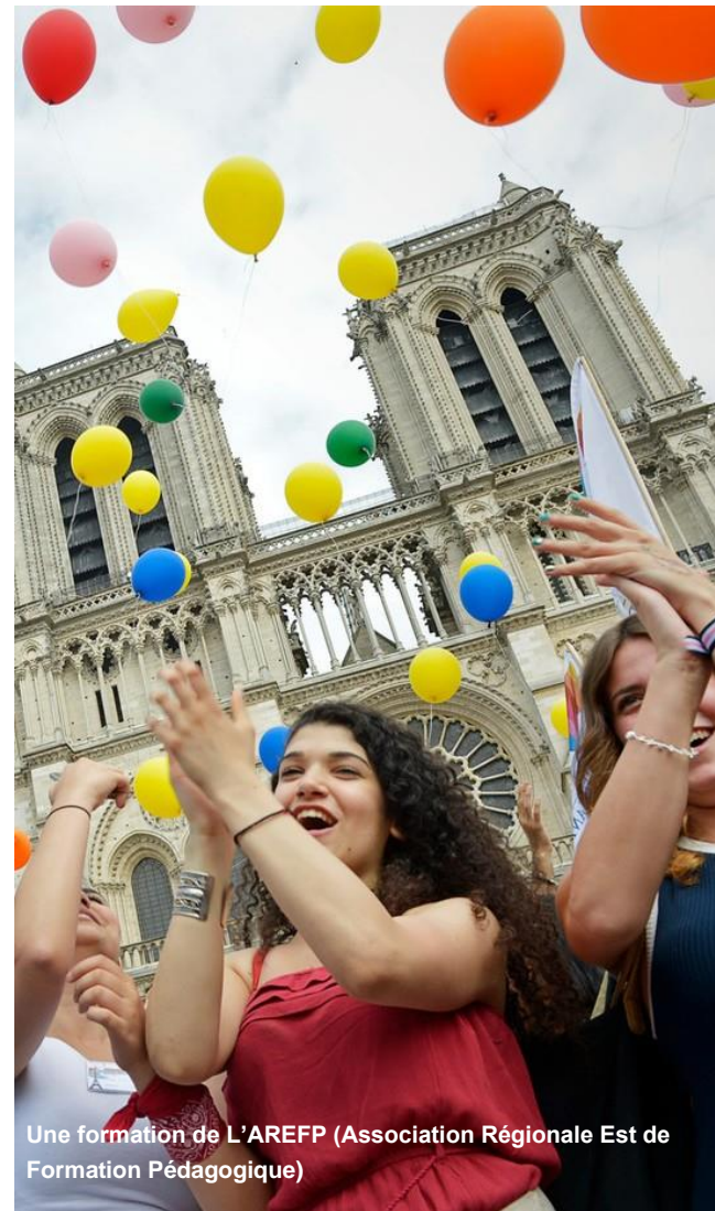
Une formation de L'AREFP (Association Régionale Est de Formation Pédagogique)